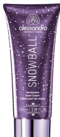
X-mas Snowball Handcreme 100 ml Tube