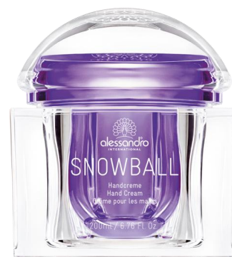
X-mas Snowball Handcreme 200ml Tiegel