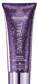
X-mas Snowball Handcreme 30ml Tube

Würzig-edle Duftessenzen wie Orange, Kardamon, Koriander, Nelke und Zimt verbreiten weihnachtliche Stimmung. Die neue Snowball-Edition von alessandro International vereint diese winterlichen Stimmungsaufheller in einer pflegenden und regenerierenden Textur, die als limitierte Handcreme in drei Grössen erhältlich ist. Dabei sorgt die geballte Kraft von Traubenkernöl, Kakaobutter, Mangobutter und Hyaluronsäure für samtige Hände in der kalten Jahreszeit. Zusätzlich steigert verkapseltes Vitamin E die Zellneubildung und sichert eine optimale Durchfeuchtung der Haut.